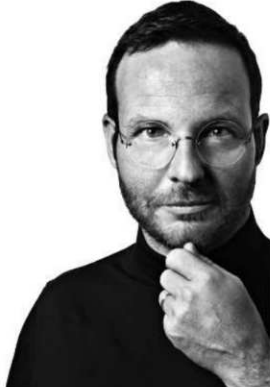
Der Komiker Claudio Zuccolini kehrt mit seinem neuen Programm «iFach Zucco» auf die Bühne zurück.

Claudio Zuccolinis viertes Bühnenprogramm «iFach Zucco» hat es in sich: Er beschäftigt sich darin intensiv mit einer Welt der materiellen Bescheidenheit.